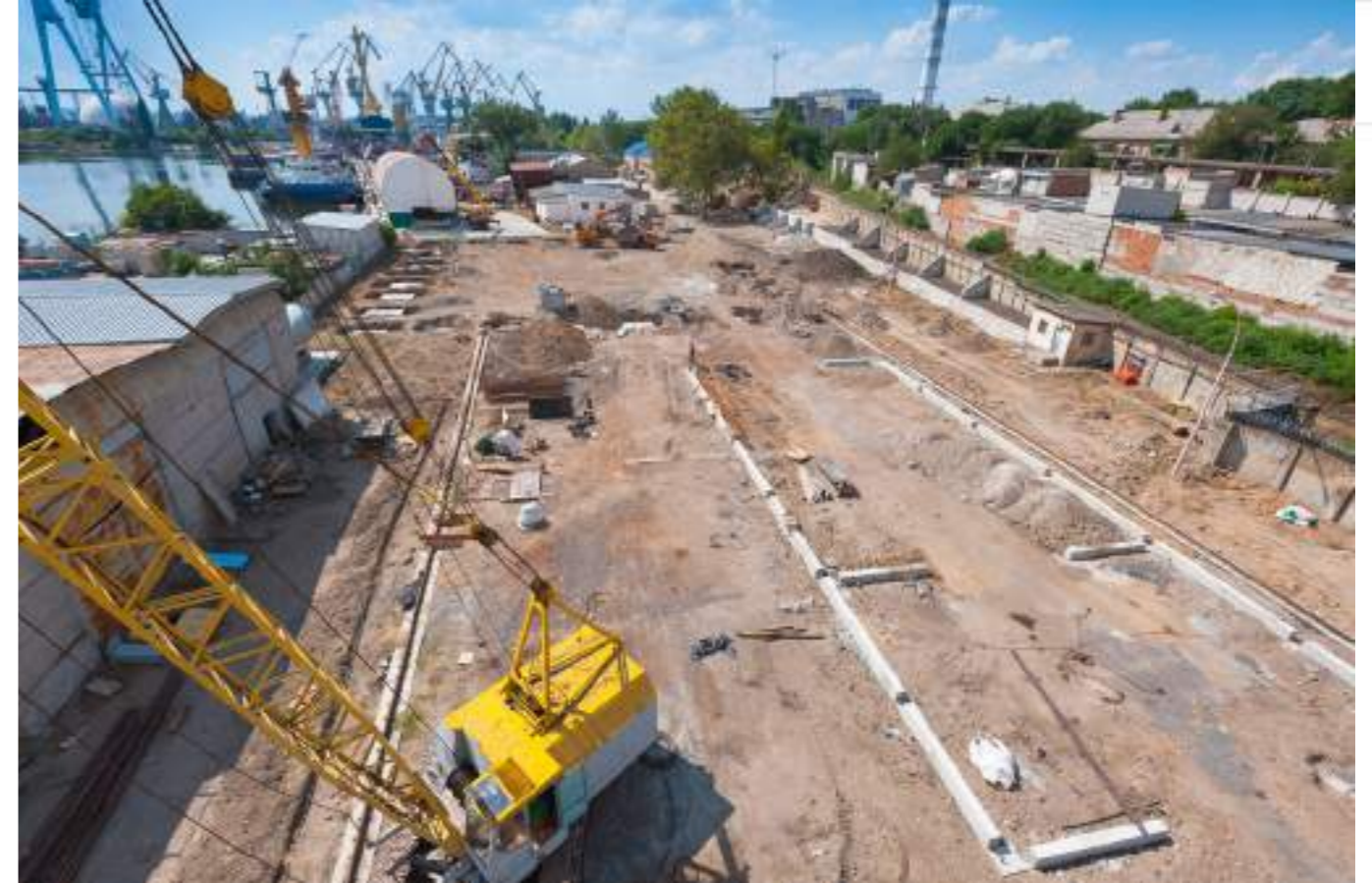
Так буде виглядати склад металу з ділянкою очистки та ґрунтовки металу і цех металообробки 01 лютого 2017 року