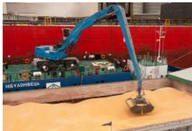
Несамохідний плавучий кран «Нібулонівець»