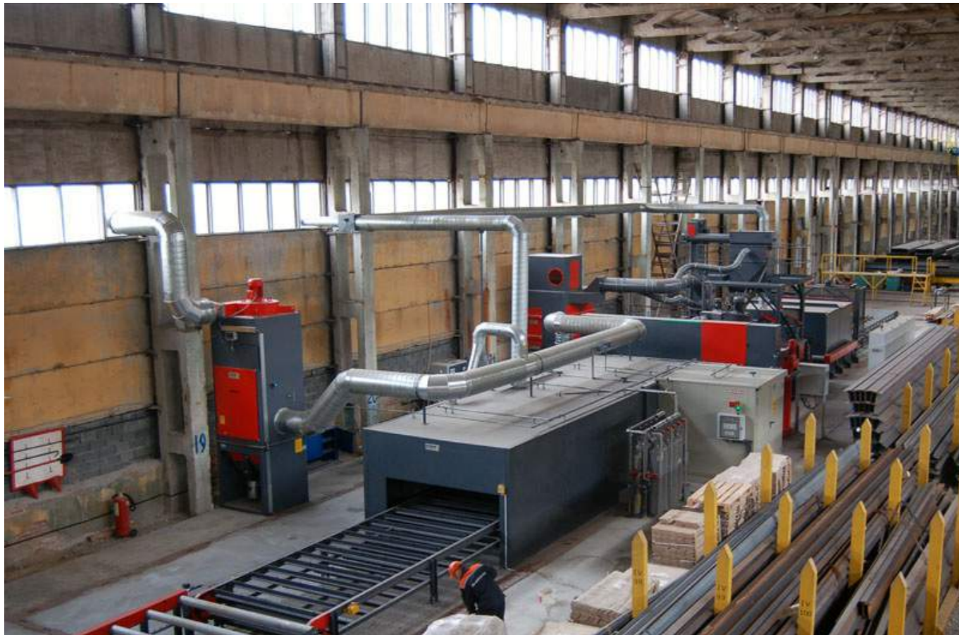
Лінія консервації прокатних листів і профілів ROSLER RRB 27/6 (Rosler Oberflächentechnik GmbH, Німеччина)